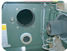
缶体内部・バーナ部

* バーナはノズルをはずさずに分解し水洗いしてください。バーナ送風機が外せる場合は外して中の水を取り除き、十分に乾かしてください。